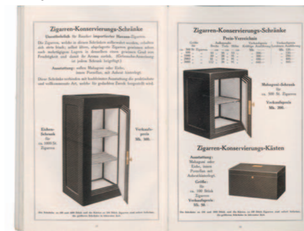
Handelskatalog von 1913

teinischen ab, von humidus: feucht. Bei der Lagerung von Cigarren ist neben der Temperatur die relative Luftfeuchtigkeit, die möglichst permanent auf einem Niveau gehalten werden sollte, entscheidend. Weil das Klima in Europa ein ganz anderes, meist wesentlich trockeneres als auf Cuba ist, war seit Einführung cubanischer Cigarren auf dem europäischen Markt eine entsprechende Lagerungsmöglichkeit notwendig.