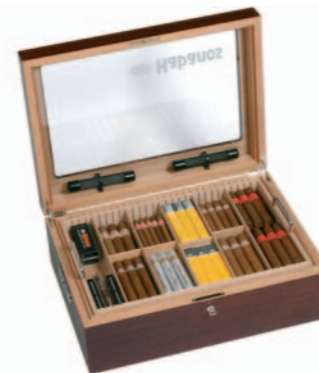
5 TH Avenue - Gastrohumidor Mahagoni

Seit wann genau es Humidore gibt, lässt sich nicht mehr eindeutig feststellen. Kisten und Schränke mit Befeuchtungssystem existieren wohl bereits seit Anfang des 20. Jahrhunderts (wie zum Beispiel im Katalog der „Havana-Handels-Gesellschaft von Barsdorf, Fischer &