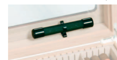
Befeuchtungsröhre in einem Humidor

Befeuchtungssysteme funktionieren entweder auf der Basis von Schwämmen oder Acrylpolymerkristallen. Die Schwämme oder Kristallbehälter (wie z.B. Befeuchtungsröhren,